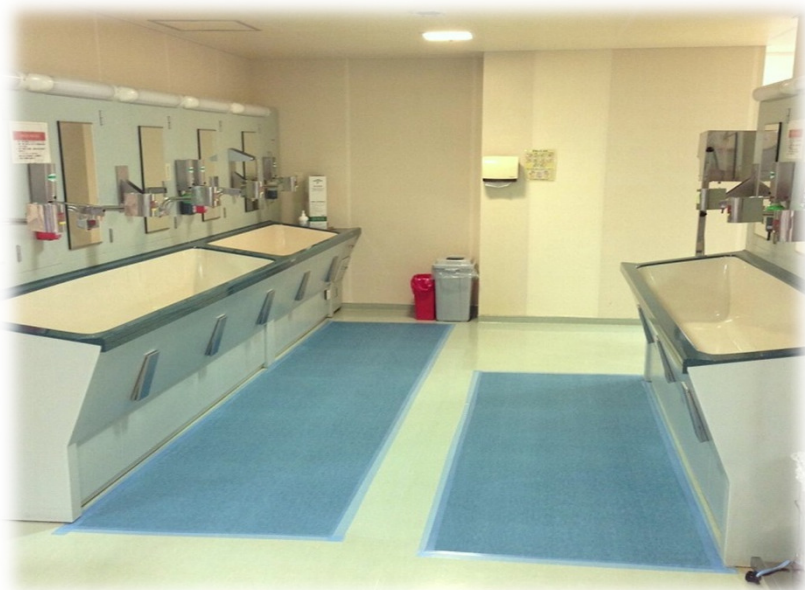
※オペ室中材 手洗い場使用例写真