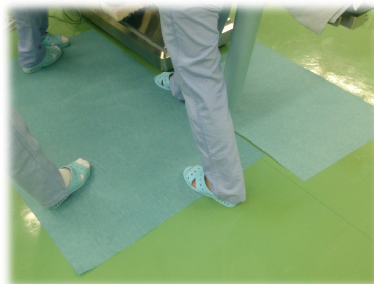
※オペ室使用例写真