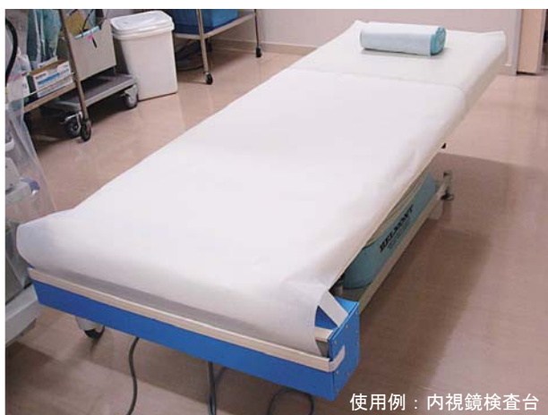
使用例：内視鏡検査台