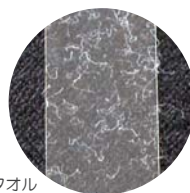
メディカルタオル