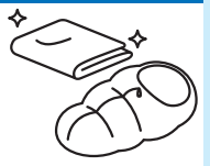
避難所生活の 環境清拭に