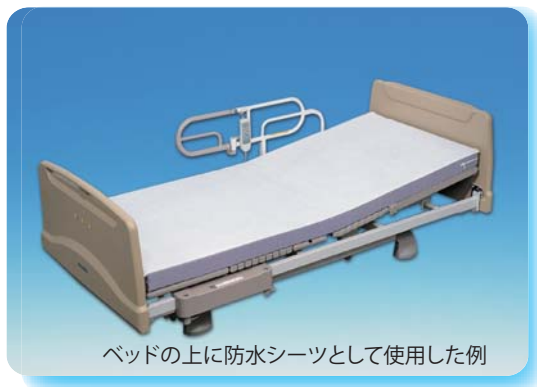
ベッドの上に防水シートとして使用した例